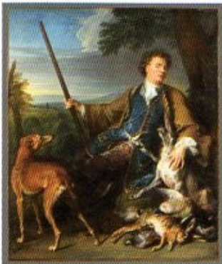
A-François Desportes, peintre des chasses de Louis XIV, né à Champigneulle

Il y aura comme d'habitude 12 mois, avec janvier au début et décembre à la fin, réunis dans 224 pages résolument ardennaises.