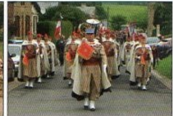
Commémoration des Spahis à La Horgne