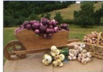
«La ferme sous le porche» à Primat